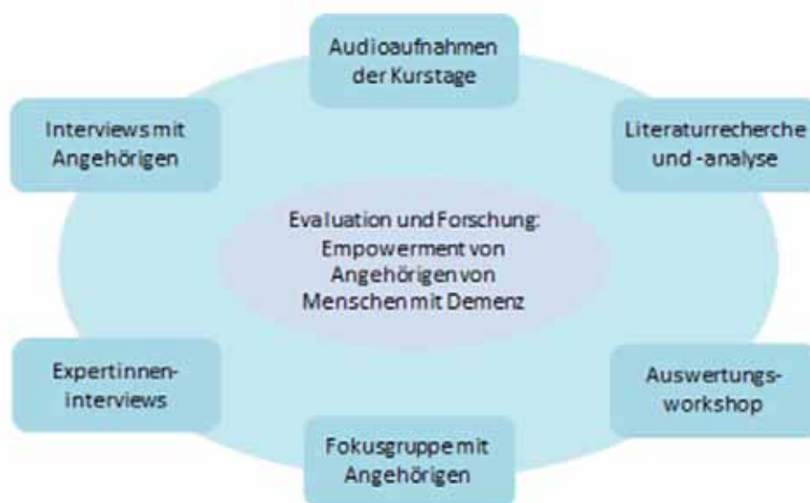
Abbildung 1: Forschungsperspektiven